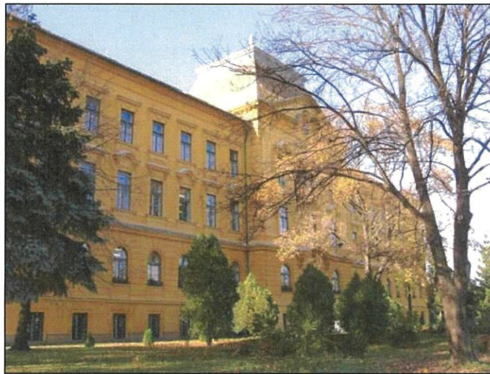
1. számú kép

Az épület a 83-as főútvonal mellett egy nagy park közepén helyezkedik el, melyhez viszonylag tágas sportudvar és parkoló is tartozik. Az intézmény két részből áll: egy 19-20 tanulócsoporthal működő technikumból és egy 120 fős kollégiumból, ahol lányok-fiúk egyaránt helyet kapnak.