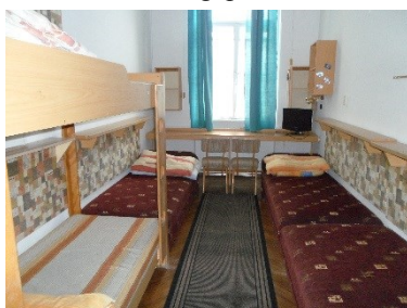
5 ágyas kollégiumi szoba