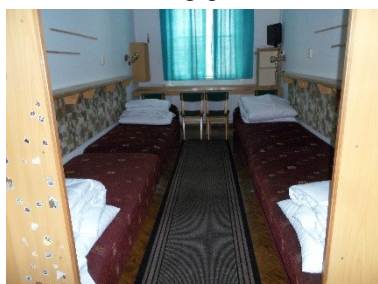
4 ágyas kollégiumi szoba